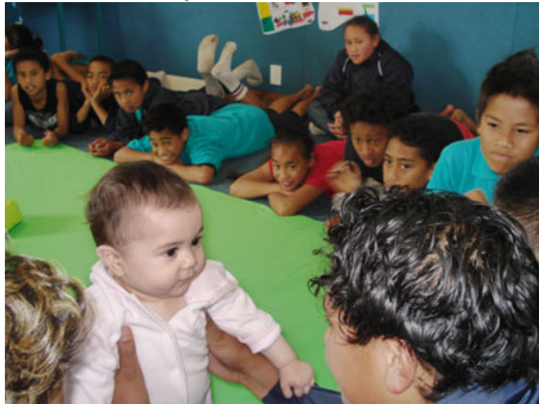
Un tout petit enseignant de Nouvelle-Zélande.

Racines de l'empathie célèbre une grande étape de son développement dans l'hémisphère sud où la rentrée scolaire vient d'avoir lieu : sa quatrième année d'existence dans un pays autre que le Canada. La Nouvelle-Zélande accueille en effet le programme international qui existe depuis le plus longtemps; en quatre ans, 4275 enfants en ont déjà bénéficié. En 2010-2011, Racines de l'empathie accueille un nouveau partenaire, Barnardos (en anglais) l'un des organismes d'aide à l'enfance les plus importants et les plus fiables de Nouvelle-Zélande, qui devient notre organisme de référence dans le pays. Racines de l'empathie s'adresse maintenant à des enfants de l'île du Nord et de l'île du Sud, dont certains dans des communautés autochtones. Le programme a débuté en 2007 à Auckland, avec 250 enfants.